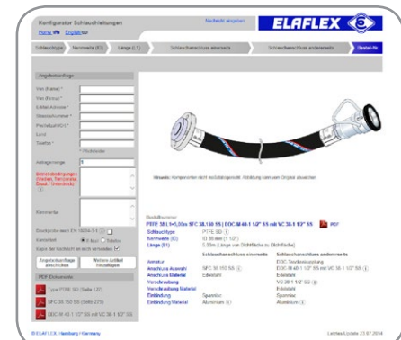
Ergebnis mit korrekter Bestellnummer und technischen Hinweisen

Industriepreis der Initiative Mittelstand 2014