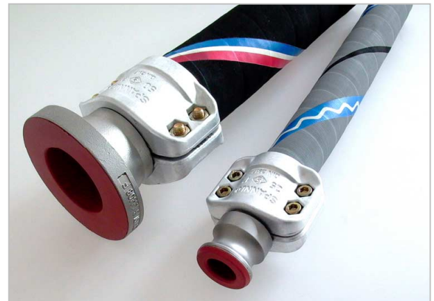
ELAFLEX universalschläuche mit PFA beschichteten Armaturen