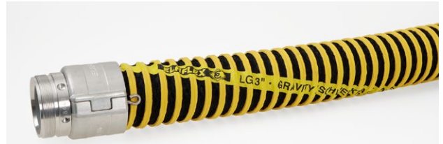
Kennzeichnung Beispiel 3":

LG 3" · GRAVITY / SCHWERKRAFT · NBR · Ω · -40°C / +70°C · 3Q18 · ELAFLEX