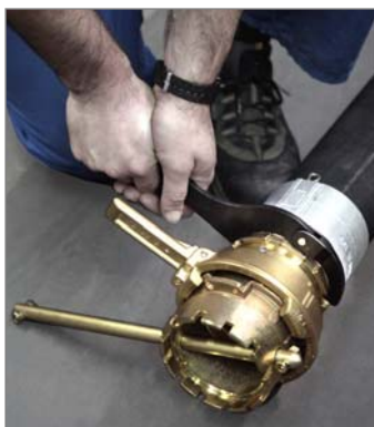
Montage: Gelenkhakenschlüssel EW-GH 90/155 und Kupplungsschlüssel

Assembly: hinged hook spanner EW-GH 90/155 and TW coupling wrench EW-K 100 Ms