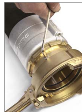
Gewindefixierung mit Sechskantschlüssel EW - SK 5 Fixing of threaded connection with hexagonal head wrench EW - SK 5

Assembly: hinged hook spanner EW-GH 90/155 and TW coupling wrench EW-K 100 Ms