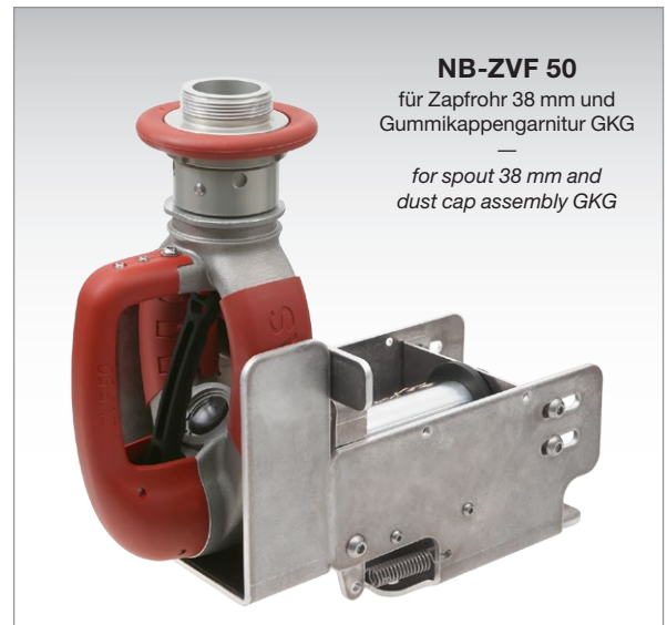
NB-ZVF 50 für Zapfrohr 38 mm und Gummikappengarnitur GKG — for spout 38 mm and dust cap assembly GKG