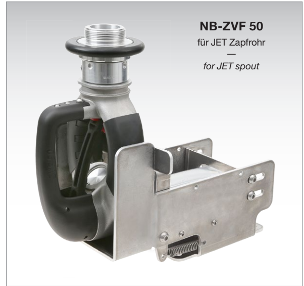
NB-ZVF 50 für JET Zapfrohr — for JET spout

For further details please contact your SAT sales team.