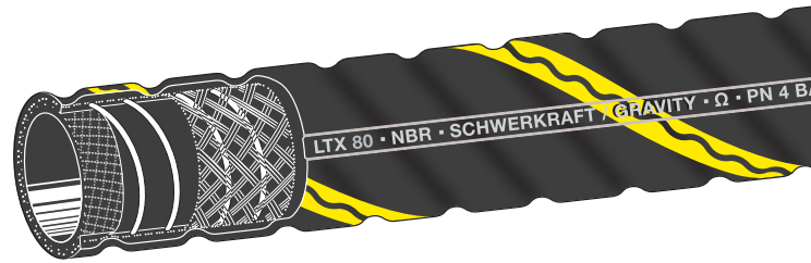
Kennzeichnung : Gelbe Spiralmarkierung und Prägebandstempelung LTX 80 · NBR · SCHWERKRAFT / GRAVITY · Ω · PN 4 BAR · ELAFLEX © 05.14

Als preiswerte und extrem leicht zu handhabende Qualitätsalternative präsentiert ELAFLEX die Type LTX, die ausschließlich für den drucklosen Betrieb (Schwerkraftabgabe) entwickelt wurde.