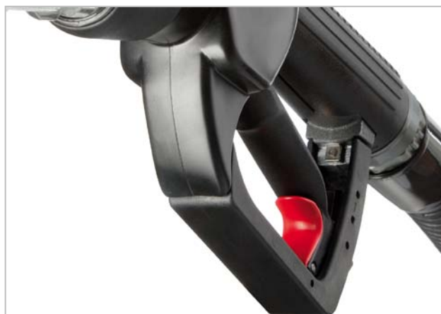
LeverAssist® Option für ZVA Slimline 2