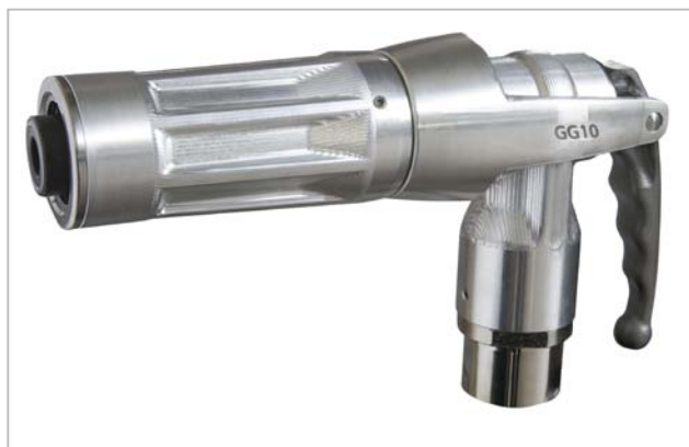
Neues HiFlo LPG Zapfventil GasGuard GG10