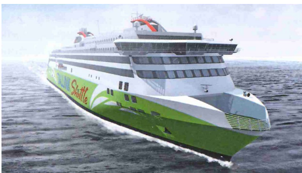
Am 29. Januar 2017 nahm die Megastar den fahrplanmäßigen Betrieb zwischen Tallinn und Helsinki auf.