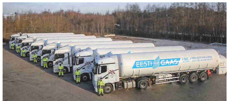
Eine imposante Flotte: Acht Trailer hat GOFA für Eesti Gaas konzipiert. Sie sind mit hochleistungsfähigen Pumpen ausgestattet.