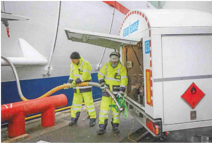
Selbstschließende Trockenklupplungen (Dry Cryogenic Couplings, DCC) der schwedischen MannTek sorgen für hohe Prozesssicherheit bei der Betankung mit LNG.