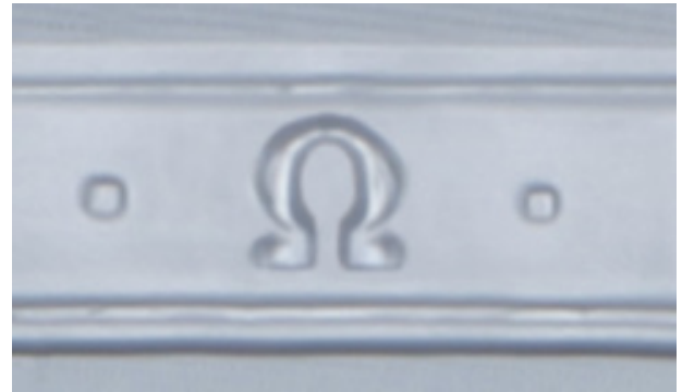
neue \Omega - Kennzeichnung:

Die nachfolgende Tabelle zeigt eine Übersicht der erfolgten Änderungen.