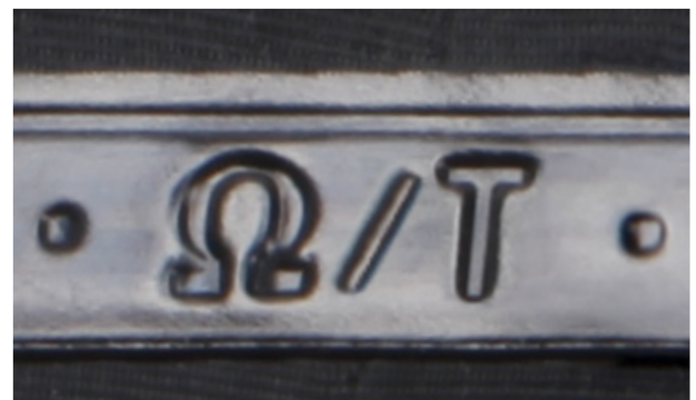
neue \Omega/T - Kennzeichnung:

Schlauch ist geeignet für explosionsfähige Gemische (Erläuterungen umseitig)