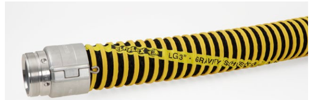
Kennzeichnung Beispiel 3" :

LG 3" · NBR · GRAVITY / SCHWERKRAFT · NBR · Ω · -40°C / +70°C · 1Q16 · ELAFLEX