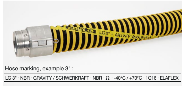
Hose marking, example 3" :

LG 3" · NBR · GRAVITY / SCHWERKRAFT · NBR · Ω · -40°C / +70°C · 1Q16 · ELAFLEX