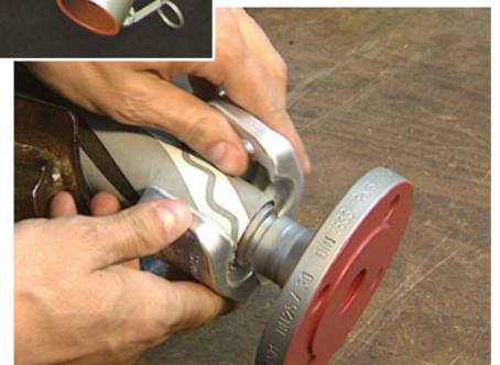
Beispiel: Type MB ...SSE