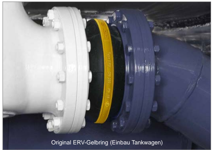
Original ERV-Gelbring (Einbau Tankwagen)

Mittlerweile wird aber leider auch die Art der Kennzeichnung, in Form eines umlaufenden Ringes, kopiert. Wir weisen darauf hin, dass z. B. nicht überall ein treibstoffbeständiger Gummi "drin ist", wo ein gelber Ring "drauf ist".