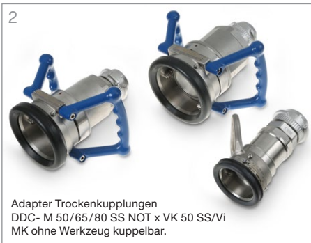
2 Adapter Trockenkupplungen DDC- M 50/65/80 SS NOT x VK 50 SS/Vi MK ohne Werkzeug kuppelbar.