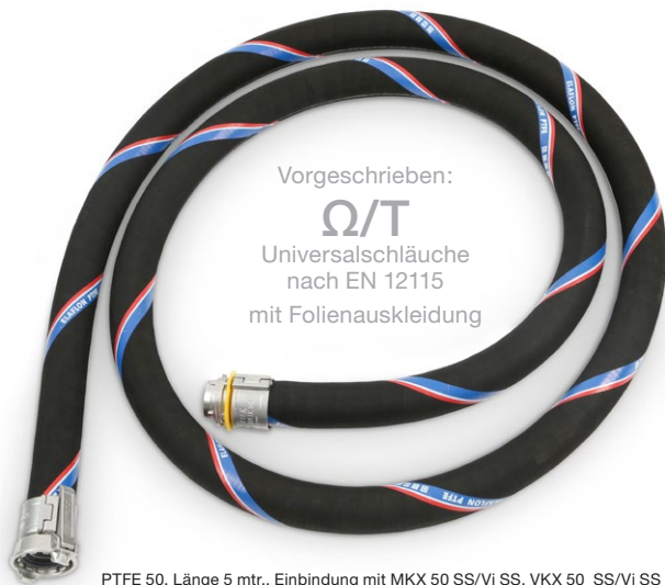
PTFE 50, Länge 5 mtr., Einbindung mit MKX 50 SS/Vi SS, VKX 50 SS/Vi SS – alternativ: UTS 50 oder Polypal Plus 50 –

Basis der Ausrüstung sind 10 Schlauchleitungen DN 50 \Omega /T-Leitfähigkeit nach EN 12115 – wahlweise Type UTS bzw. Polypal Plus (UPE-Innenschicht) oder Elaflon PTFE (PTFE-Innenschicht). Schlaucharmaturen nach DIN EN 14420-6 mit TW-Vater- und Mutterkupplung aus Edelstahl (Blindkappen und -stopfen siehe Bild 11). Einbindung mit Spannfix- oder Spannloc Sicherheitsklemmschalen aus Edelstahl.