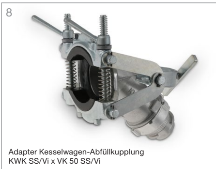
8 Adapter Kesselwagen-Abfüllkupplung KWK SS/Vi x VK 50 SS/Vi