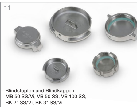
11 Blindstopfen und Blindkappen MB 50 SS/Vi, VB 50 SS, VB 100 SS, BK 2" SS/Vi, BK 3" SS/Vi