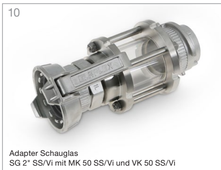
10 Adapter Schauglas SG 2" SS/Vi mit MK 50 SS/Vi und VK 50 SS/Vi