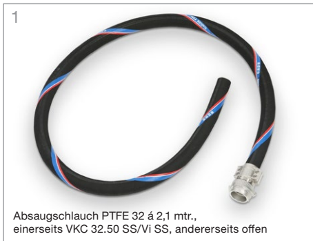
1 Absaugschlauch PTFE 32 á 2,1 mtr., einerseits VKC 32.50 SS/Vi SS, andererseits offen

Hinweis: Bei allen Bestellungen bitte "Für GW-G" erwähnen. Auf diese Weise wird sichergestellt, dass Schraubverbindungen an Übergangskupplungen ab Werk gegen ungewolltes Lösen gesichert sind und alle Gewinde- und Kupplungsdichtungen aus dem für GW-G präferierten Material FKM (FPM) geliefert werden.