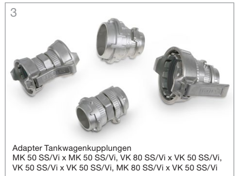
3 Adapter Tankwagenkupplungen MK 50 SS/Vi x MK 50 SS/Vi, VK 80 SS/Vi x VK 50 SS/Vi, VK 50 SS/Vi x VK 50 SS/Vi, MK 80 SS/Vi x VK 50 SS/Vi