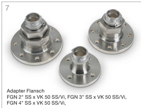
7 Adapter Flansch FGN 2" SS x VK 50 SS/Vi, FGN 3" SS x VK 50 SS/Vi, FGN 4" SS x VK 50 SS/Vi,