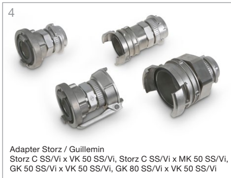
4 Adapter Storz / Guillemin Storz C SS/Vi x VK 50 SS/Vi, Storz C SS/Vi x MK 50 SS/Vi, GK 50 SS/Vi x VK 50 SS/Vi, GK 80 SS/Vi x VK 50 SS/Vi