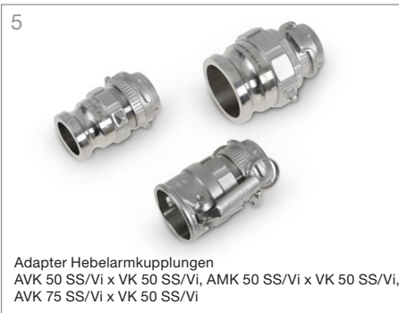
5 Adapter Hebelarmkupplungen AVK 50 SS/Vi x VK 50 SS/Vi, AMK 50 SS/Vi x VK 50 SS/Vi, AVK 75 SS/Vi x VK 50 SS/Vi