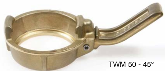
TWM 50 - 45°