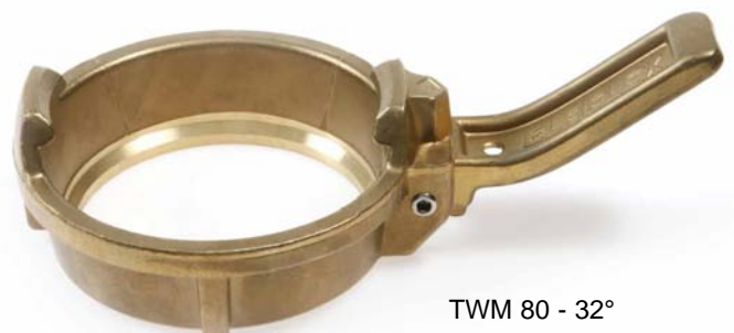
TWM 80 - 32°