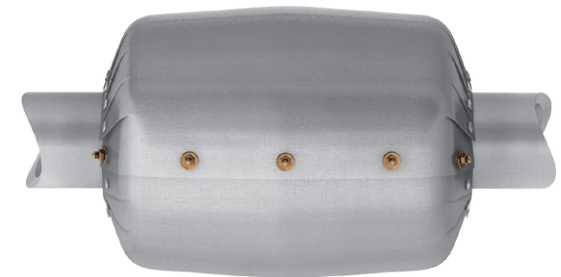
geschlossen / closed

Produktkonfigurator für ERV-Gummikompensatoren: http://ervkonfigurator.elaflex.de