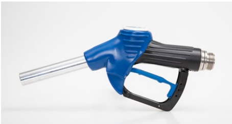
Zapfventil ZV SW ZV SW nozzle

Für die Abgabe von Scheibenwischwasser an Zapfsäulen hat Elaflex das nicht-automatisch schließende Zapfventil ZV SW entwickelt. Es vereint eine hohe Lebensdauer mit wertiger Optik und leichter Handhabung ähnlich den konventionellen Zapfventilen an der Tankstelle, auch bei kalten Umgebungstemperaturen.