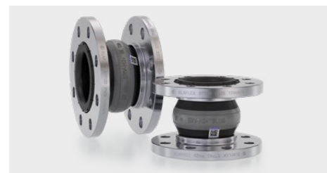
Gummikompensatoren ERV-H2+ Rubber Expansion Joints ERV-H2+

With the H2 hydrogen hoses for the low-pressure range , Elaflex supplies \Omega /T connection hoses for the transfer up to 100% hydrogen. The continuous smooth inner lining enables a processing of hydrogen e.g. the chemical or steel industry. The robust hose construction with 20 bar (2 MPa) operating pressure has a very low permeation of < 0.36 \text{ Ncm}^3/\text{h} . The H2 hoses DN 13-50 are available with crimping ferrules, SPANNLOC or SPANNFIX clamps.