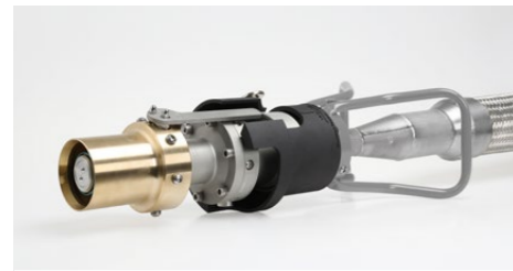
Zapfventil N-LH2 mit Schlauchleitung N-LH2 nozzle with hose assembly

Mit dem Zapfventil N-LH2 und Schlauchleitung bietet Elaflex die weltweit erste Lösung für die LH2 LKW-Betankung mit kryogenem Wasserstoff an. Die Handhabung ist vergleichbar mit unseren Trockenkupplungen ('Push-Turn' für Durchfluss / 'Turn-Pull' für Schließen). Das Zapfventil hat eine integrierte Spülfunktion. Die Betankungskomponenten sind für den Temperaturbereich von -253 °C bis +50 °C sowie Betriebsdruck von 25 bar (2,5 MPa) geeignet und verfügen über eine gemeinsame Vakuumisolierung.