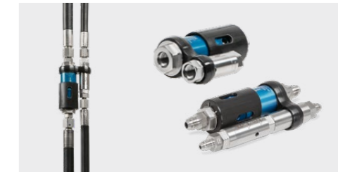
Abreißkupplungen SB-CNG, Schlauchleitungen CNG SB-CNG safety breaks, hose assemblies CNG