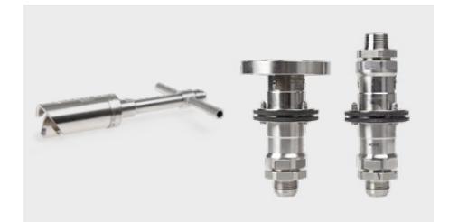
Entlüftungskupplung VC-LNG, Abreißkupplungen SB-LNG VC-LNG vent coupling, SB-LNG safety breaks