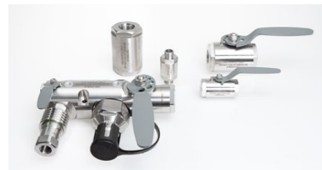
Kugelhähne, Rückschlagventile, Schnellkupplungen Ball and Check Valves, Quick Couplers

Im Bereich von hochverdichteten H2 Wasserstoff sind jetzt Kugelhähne , Rückschlagventile und Schnellkupplungen bis zu 1" verfügbar. Sie werden für die Be- und Entladung von Wasserstoff-Fahrzeugen und 'Virtual Pipelines' eingesetzt. Unser Equipment erlaubt wesentlich höhere Durchflussraten als konventionelle H2 Befüllkomponenten, die für einen Betriebsdruck von 350 bar (35 MPa) geeignet sind.