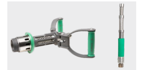
Zapfventil N-LNG, Schlauchleitungen LNG N-LNG nozzle, LNG hose assemblies