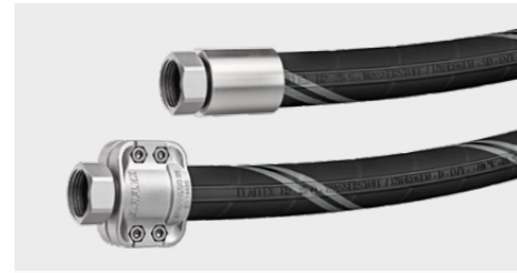
H2 Wasserstoffschläuche für Niederdruck H2 Hydrogen Hoses for Low Pressure

Mit den H2 Wasserstoffschläuchen für den Niederdruckbereich liefert Elaflex \Omega /T-Verbindungsschläuche für den Transfer bis zu 100% Wasserstoff. Sie haben einen größeren Innendurchmesser als vergleichbare Schläuche. Die durchgängige, glatte Innenseite eignet sich für die Verarbeitung von Wasserstoff u.a. in der Chemie- oder Stahlindustrie. Die robuste Schlauchkonstruktion mit 20 bar (2 MPa) Betriebsdruck weist eine sehr geringe Permeation von < 0.36 \text{ Ncm}^3/\text{h} auf. Die H2 Schläuche DN 13-50 sind mit Hülsenverpressung, SPANNLOC- oder SPANNFIX-Einbindung lieferbar.