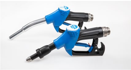
Zapfventile ZVA AdBlue LV und ZVA AdBlue HV ZVA AdBlue LV and ZVA AdBlue HV nozzles

Die Zapfventilgehäuse ZVA AdBlue LV und ZVA AdBlue HV werden in 2022 auf das 'Composite Body' umgestellt. Damit wird die Zuverlässigkeit und Handhabung dauerhaft optimiert. Das Material ändert sich von beschichtetem Aluminium in Kunststoff. Zudem wird ein neu entwickelter Ventilsitz verwendet.