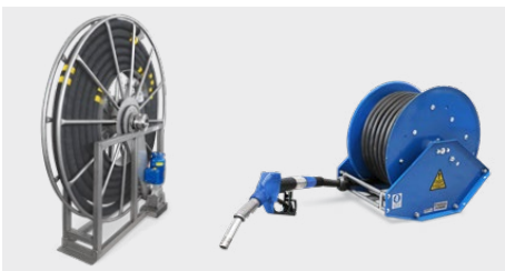
Kundenspezifische und VR Schlauchtrommel Customised Hose Reel and VR Hose Reel

Als Systemanbieter für Schlauchtrommeln , Schlauch und Armatur / Zapfventil für verschiedene Medien und Anwendungen sind wir der einzige Anbieter im Markt, der auch Schlauchtrommeln mit und ohne Gasrückführung anbietet. Die VR Schlauchtrommel ist mit einer automatischen federbelasteten Rückholung ausgestattet und für COAX-Zapfschläuche bis 20m Länge geeignet. Außerdem bieten wir auch Schlauchtrommeln für große Schlauchdurchmesser DN 50 (2") bis 200 (8") an, die in vielen gewünschten Schlauchlängen geliefert werden können. Dazu werden diese nach Kundenspezifikation mit verschiedenen Rückholmechanismen ausgestattet, z.B. manuell, Rückholfeder, elektrisch, hydraulisch oder pneumatisch.