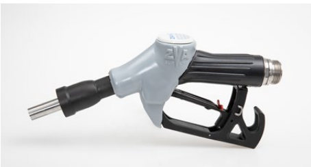
Zapfventil ZVA H2O ZVA H2O nozzle

Das Zapfventil ZVA H2O dient der Betankung von Benzinfahrzeugen zur Einspritzung von demineralisiertem Wasser nach ISO 31120-1, um die Euro 7 Abgasnorm einzuhalten. Es verfügt über eine automatische Abschaltung und einen integrierten Fehlbetankungsschutz für Benzin- und Dieseltankstutzen. Das ZVA H2O schützt zuverlässig vor Verunreinigungen des Abgabemediums.