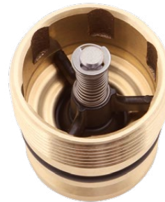
Einheitsventil-Baugruppe EA 055

für alle ZVA Slimline 2 und Slimline 2 GR Zapfventile