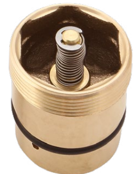
für ZVA Slimline 2 HiFlo