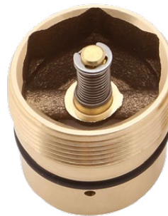
für ZVA Slimline 2/ ZVA Slimline 2 GR