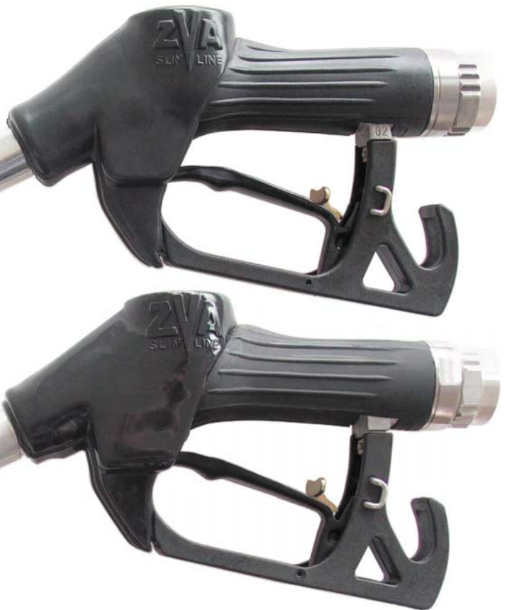
KOPIE ("Great Wall")