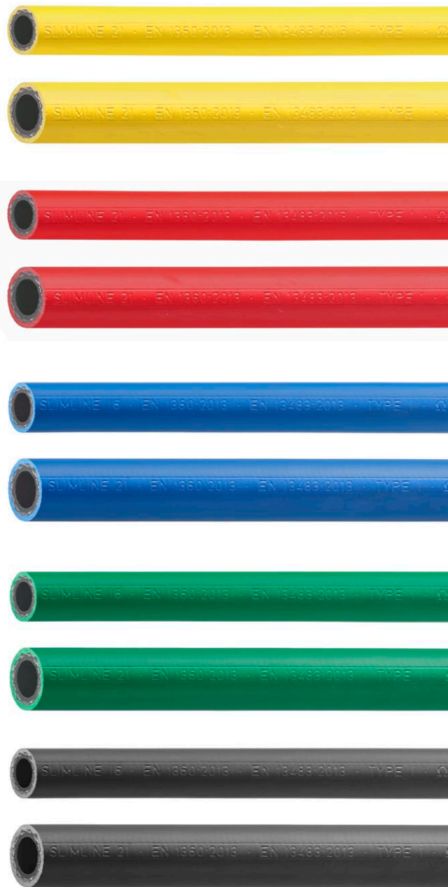
Slimline-Schläuche DN 16 + 21

Durch das gleiche Erscheinungsbild von schwarzen und farbigen Schläuchen sehen Kombinationen an der Zapfsäule noch besser aus. Ein Grund mehr, Farbe an die Säule zu bringen.